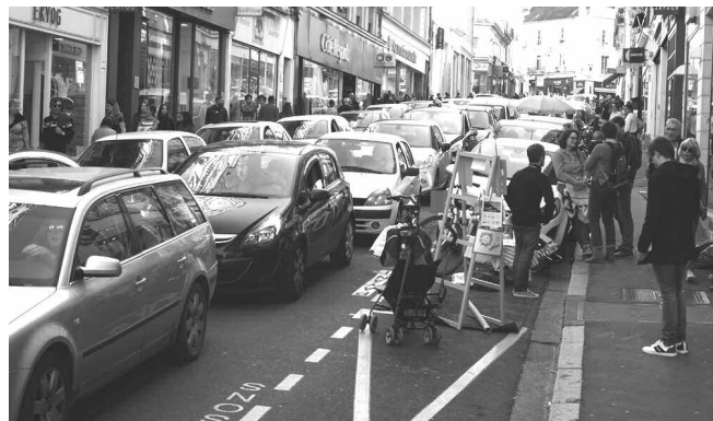
Rue Voltaire, dans l'entonnnoir à voitures d'un samedi, nous avons occupé quelques places de stationnement pour le « Parking Day »

On apprécierait encore plus de ne pas avoir à réclamer l'évidence.