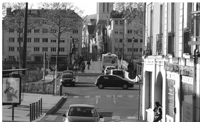
L'axe du pont de Verdun : beaucoup de voitures dans une circulation complexe

Nous exprimons nos craintes, dans la dernière Bicyclette, de voir mis en place un axe de circulation à 2 x 2 voies entre le pont de Verdun et le