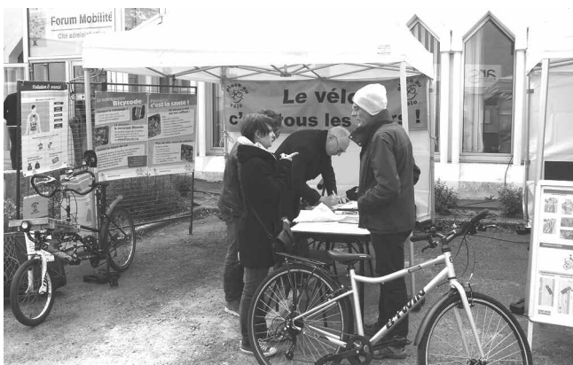
Le 2 avril, nous étions à la Cité administrative à la rencontre des salariés qui cherchent des alternatives à la voiture pour venir travailler